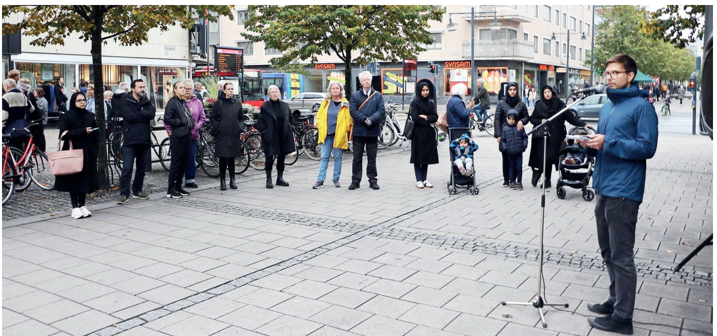
Talarna under manifestationen delade budskapet att svaret på komplexa samhällsproblem egentligen är rätt enkelt - solidaritet, medmänsklighet och gemenskap.