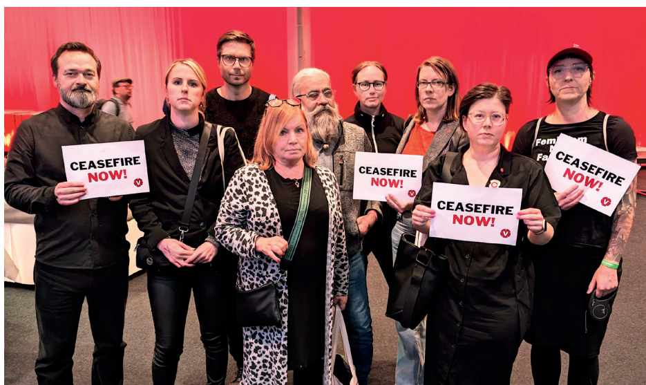
Deltagarna från Norrbotten under Vänsterdagarna i Göteborg i november.

Distriktsstyrelsen för Vänsterpartiet Norrbotten